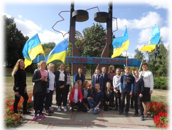
Учні 6-А класу біля пам'ятника героям партизанам

Вічна пам'ять і вічна слава усім, хто обороняв і обороняє нашу Україну від ворожих зазіхань.