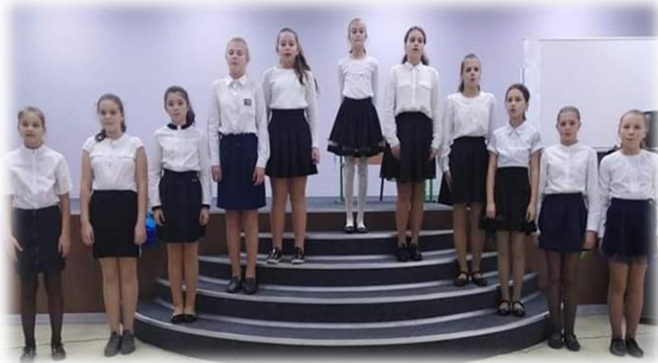
Виступ ансамблю «Мелодика»