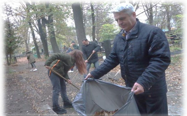
Фрагмент упорядкування братської могили