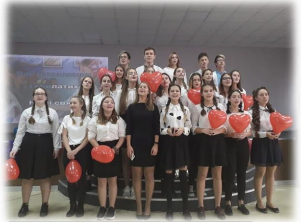
Фрагмент виконання пісні учнями закладу