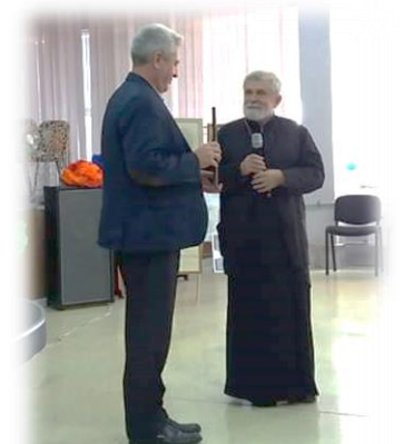
Вручення ікони директору школи настоятелем храму