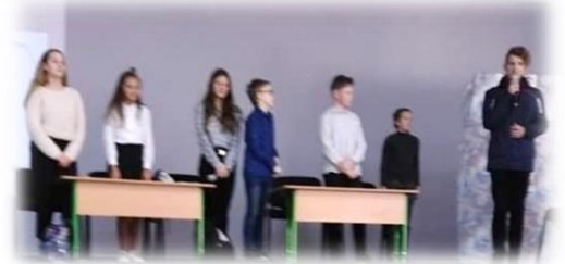
Міні-вистава у виконанні учнів 8-А класу

Учасники заходу пригадали, як у 2014 році було розроблено названий проект і розпочато співпрацю.