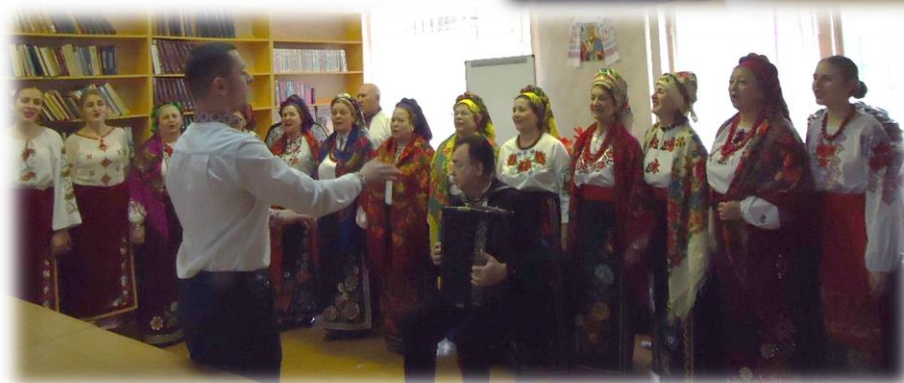
Виступ хору народної пісні «Надія»