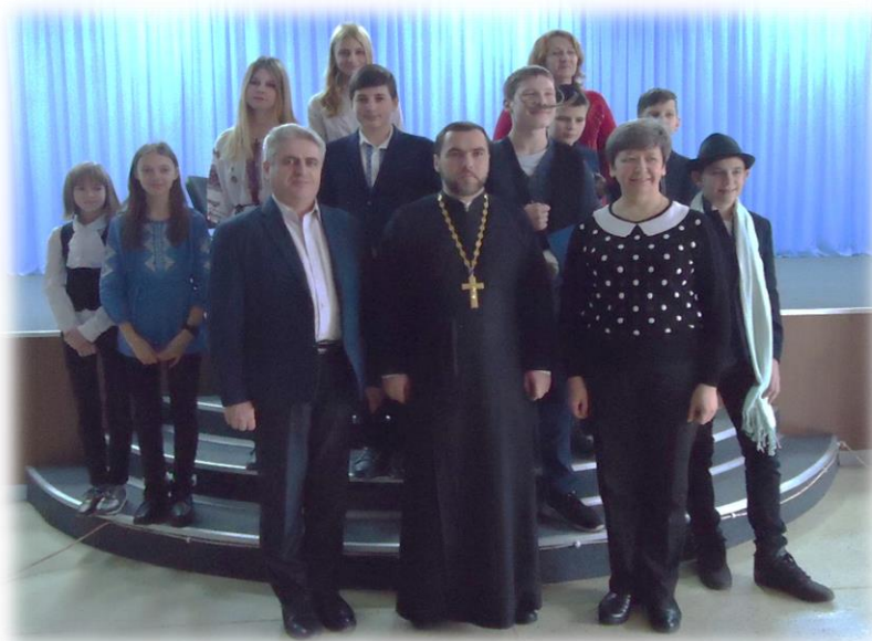
Спільне фото учасників заходу