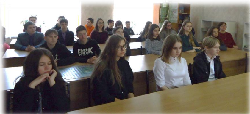
Фото під час заходу