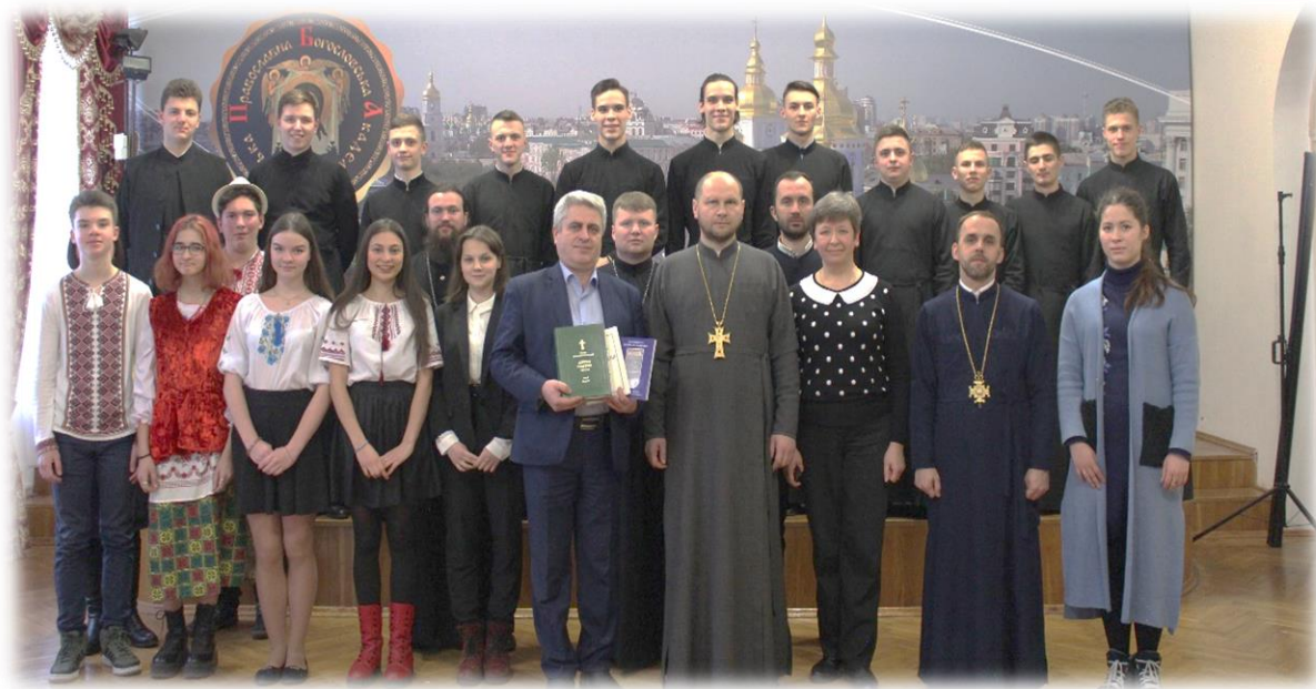
Спільне фото учасників заходу