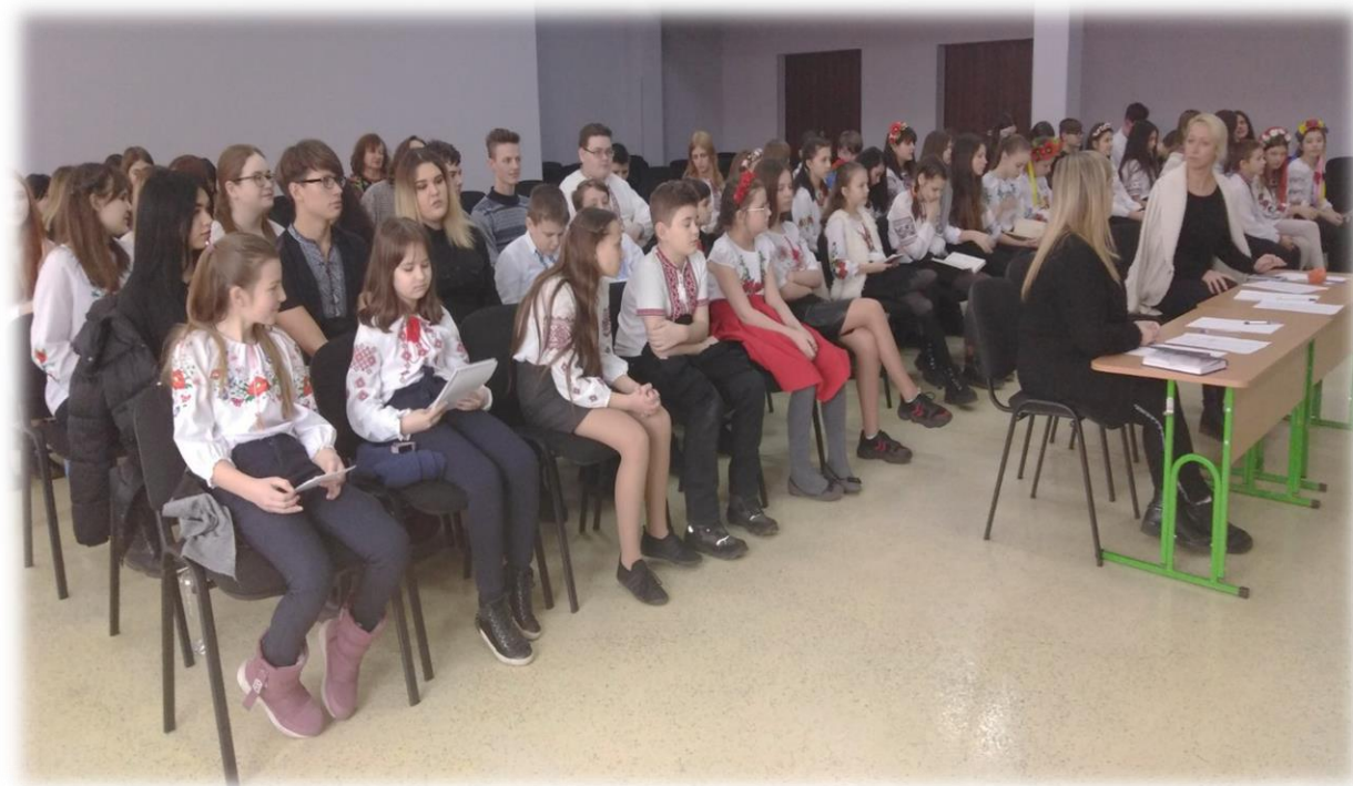
Фото під час проведення конкурсу

Напередодні початку весняних Шевченківських днів, в нашому закладі традиційно відбувся конкурс читців поезії Тараса Шевченка. Цього року в конкурсі читання поезії брали участь більше десятка вихованців нашого закладу різних вікових категорій. Вітаємо переможців конкурсу та зичимо наснаги в проведенні цього заходу в наступному році!